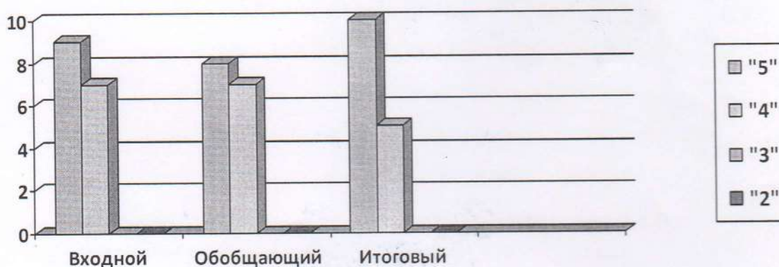
Динамика качества знаний по музыке в 5 "А" классе